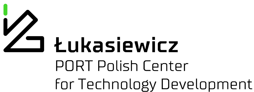
C. Logo firmy – PORT pionowe pełne